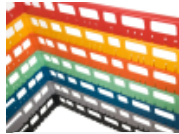
optie- bovenrand- clixrack-600