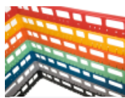
optie- bovenrand- clixrack-600