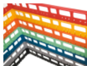
optie- bovenrand- clixrack-600