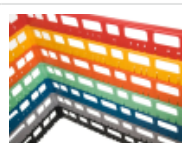
optie- bovenrand- clixrack-600